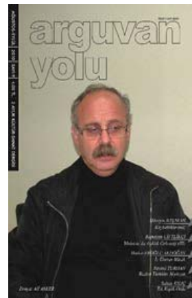
Görsel 1-2 : Arguvan Türküleri hakkında hazırlanmış kitap ve dergi