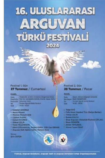
Görsel 5-6-7: Uluslararası Arguvan Türkü Festivali Afişleri